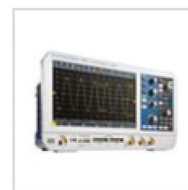
Urządzenia testowe i pomiarowe

Współpracujemy z najlepszymi i ciągle poszerzamy naszą ofertę o nowe produkty