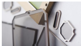
Szyby szczelne EMC