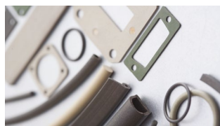
Uszczelki EMC elastomerowe

Nasza strategia oraz proces zarządzania skierowane są na zadowolenie naszych klientów z produktów oraz rozwiązań technologicznych, które dostarczamy. Współpracujemy z wiodącymi europejskimi producentami i naszymi działaniami zwiększamy popularność naszych marek na polskim rynku.