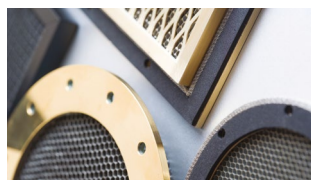
Ekranowane panele wentylacyjne