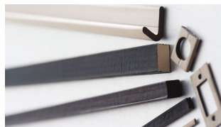
Uszczelki EMC piankowe