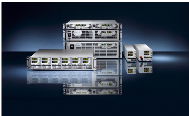
Zasilacze programowalne TDK-Lambda

Zasilacze programowalne – w ofercie mamy zasilacze TDK-Lambda z regulacją napięcia i prądu, programowaniem ręcznym oraz poprzez Ethernet, interfejs szeregowy RS232/485 oraz wejścia analogowe. Zasilacze tego typu są przeznaczone do budowy zautomatyzowanych systemów testowych i pomiarowych. Z powodzeniem są również stosowane jako zasilacze laboratoryjne. Opcjonalnie oferujemy wersje z rozpraszaniem energii z hamowania silników DC. Zasilacze z serii Genesys, Genesys+ oraz Z+ to światowa czołówka w dziedzinie zasilaczy programowalnych, co jest poparte 5-letnią gwarancją oraz wieloma referencjami.