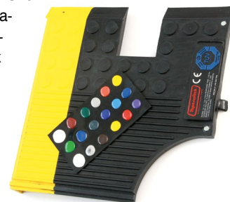
Przycisk specjalny Tapeswitch

Tapeswitch – znane w automatyce z listew i mat bezpieczeństwa. Taśmy czułe na nacisk firmy Tapeswitch znakomicie sprawdzają się przy produkcji różnego rodzaju przycisków, pół wykrywających nacisk, detektorów do testów zderzeniowych pojazdów itp. Wykonujemy nietypowe zlecenia w zakresie konstrukcji, wymiarów oraz wytrzymałości detektorów nacisku.