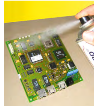
SL 1307 FLZ-S w formie aerozolu