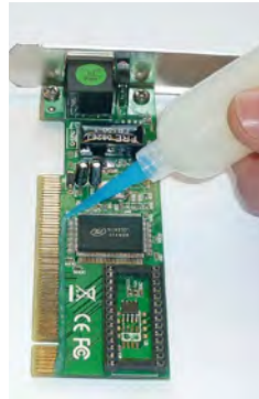
SL 1307 FLZ-T do nanoszenia przegród